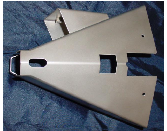
Niro-Motorhalterung für Torqeedo – Ultralight 403 an KLEPPER-Aerius 490, 520, 545 und 585 u. weitere... Stck. 294,40 € inkl. MwSt zzgl. Versandkosten